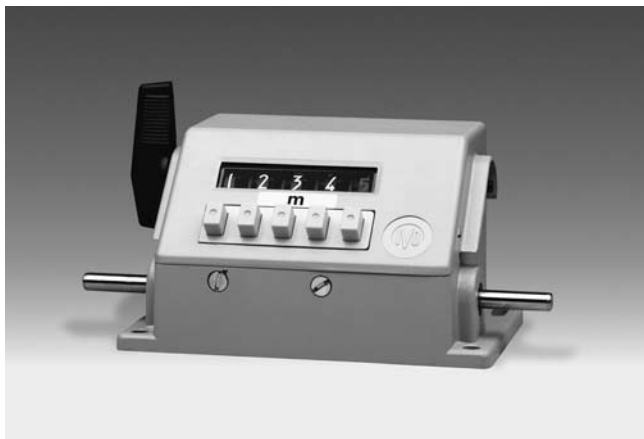
ME230 - Compteur métreur