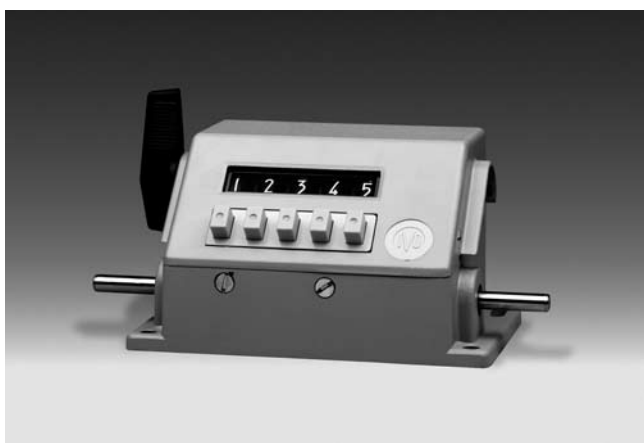
UE230 - Compteur de tours