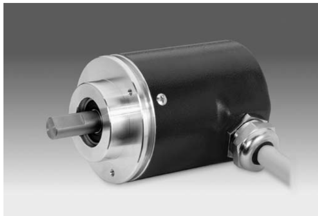
GXP1W avec bride standard